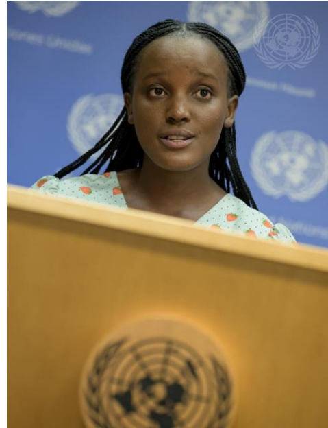
À New York, Vanessa Nakate, militante ougandaise du climat et ambassadrice de bonne volonté de l'UNICEF, répond aux questions des journalistes au sujet de son récent voyage dans la Corne de l'Afrique.

Dans d'autres contextes, comme dans le Pacifique, la réinstallation planifiée est devenue une stratégie de dernier recours pour faire face aux effets actuels et projetés des changements climatiques, tels que l'élévation du niveau de la mer 31 . Le Gouvernement fidjien a ainsi recensé plus de 40 villages côtiers de faible altitude qui feront l'objet d'une réinstallation planifiée 32 , et le Gouvernement kiribatien a acheté des terres aux Fidji en prévision des besoins futurs de sa population. Dans les cas où les communautés se déplacent ensemble de manière forcée ou volontaire, les femmes et les hommes peuvent vivre des expériences différentes de la réinstallation. Après la réinstallation de la communauté fidjienne de Vunidogoloa dans une zone située plus loin à l'intérieur des terres, les hommes, qui travaillaient principalement dans l'agriculture, ont pu garder les mêmes moyens de subsistance, alors que les femmes, qui avaient l'habitude de pêcher, se sont retrouvées plus éloignées de la mer, ce qui signifie que la pêche nécessiterait désormais un engagement de temps plus important 33 . Cet exemple témoigne de l'influence que peuvent avoir les rôles de genre sur les schémas de mobilité et les expériences de réinstallation.