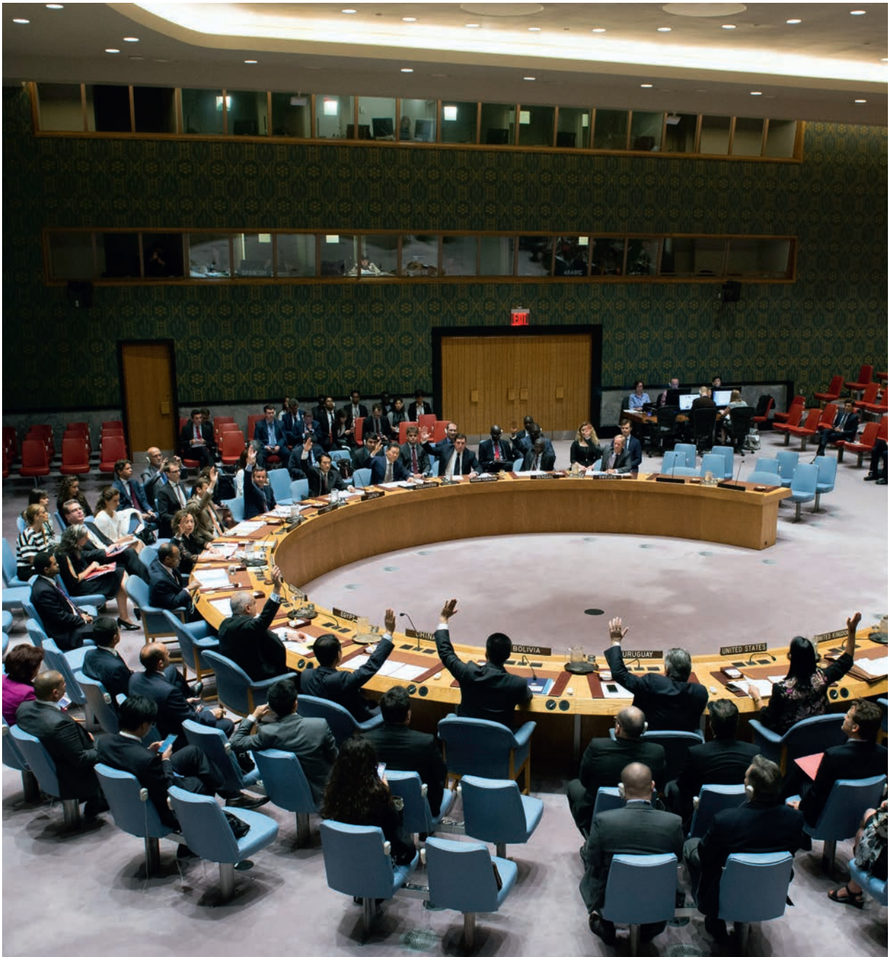
Le Conseil de sécurité de l'ONU adopte à l'unanimité la Résolution 2376 (2017), prolongeant le mandat de UNSMIL, New York, le 14 septembre 2017.

leurs résultats. Cette conviction est au cœur de ma vision de la médiation et de l'initiative que j'ai prise en vue de doter l'Organisation des capacités dont elle a besoin pour répondre aux besoins de ses partenaires. Les sections ci-après rendent compte des moyens dont nous disposons pour appuyer la médiation, laquelle englobe, aux fins du présent rapport, les activités de médiation, de facilitation et de dialogue. ■