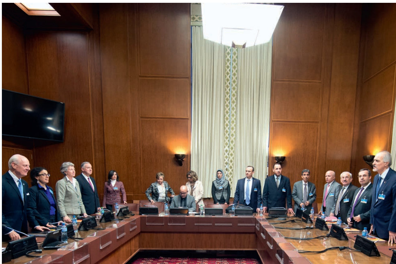
Les pourparlers intra-syriens facilités par l'ONU débutent, à Genève, en Suisse, le 29 janvier 2016.

Au Mali, mon Représentant spécial a offert ses bons offices pour soutenir l'application d'un accord de paix fragile.