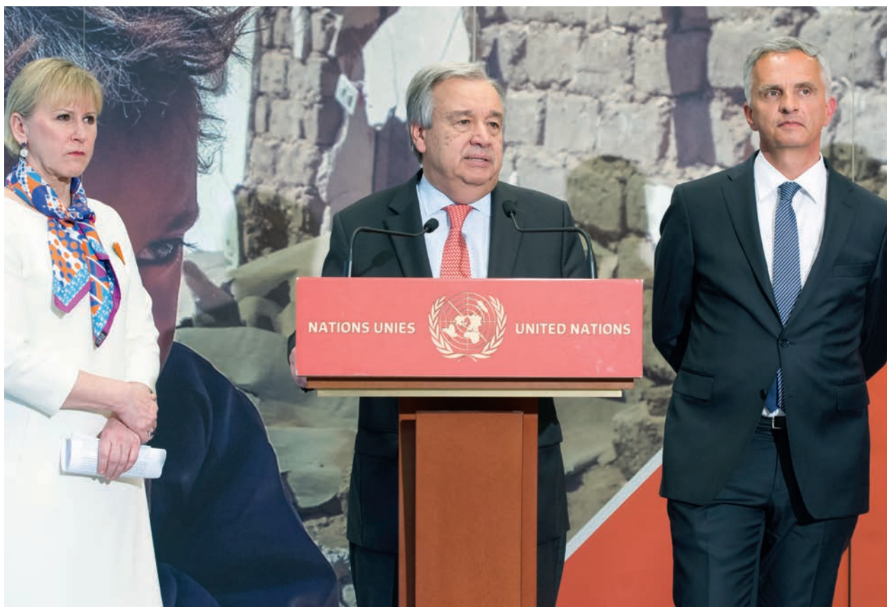
Le Secrétaire général de l'ONU, António Guterres, s'adresse à des journalistes suite à la conférence des donateurs pour la crise humanitaire au Yémen, à Genève, en Suisse, le 25 avril 2017.

l'Assemblée nationale, ainsi qu'à des représentants des groupes armés, à des personnalités religieuses et à des acteurs de la société civile, de participer aux réunions liées au processus de paix. Pour faciliter les négociations, entièrement contrôlées par les Chypriotes et menées par leurs dirigeants, la Force des Nations Unies chargée du maintien de la paix à Chypre (UNFICYP) fournit un appui dans les domaines de la logistique et de la sécurité pour les réunions des dirigeants, qui se tiennent dans la zone tampon, ainsi qu'un appui administratif à ma mission de bons offices par l'intermédiaire de sa composante Appui.