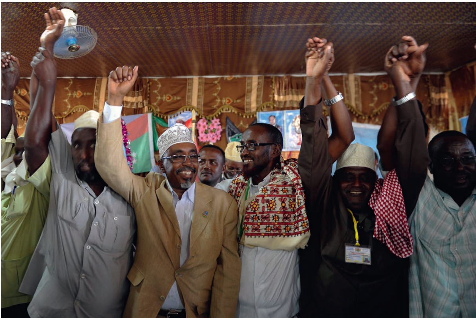
Sharif Hassan Sheikh Adan (centre), Chef de l'Administration Intérimaire du Sud-ouest (ISWA), et des anciens des clans célèbrent la fin fructueuse d'une conférence de réconciliation visant à mettre un terme aux affrontements interclaniques à Afgoye, en Somalie, le 27 janvier 2015.

les réseaux sociaux peut parfois limiter la capacité d'un médiateur ou d'un facilitateur d'établir avec les parties à un conflit le type d'interaction discrète dont elles ont besoin pour régler leurs différends.