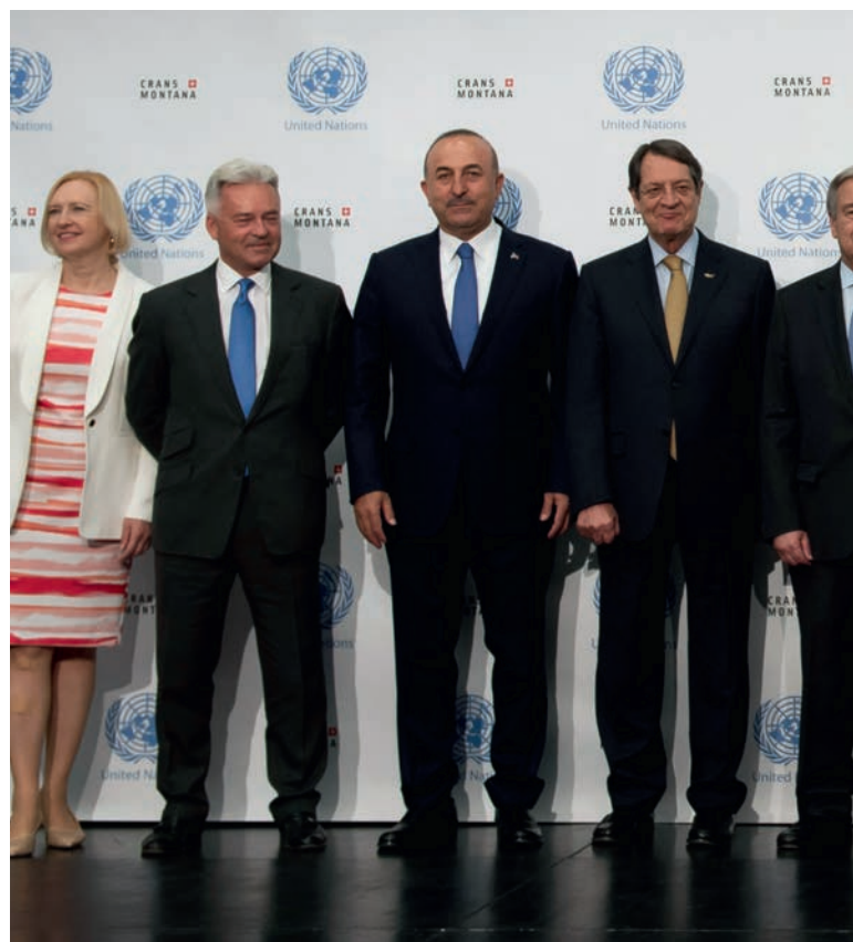
Le Secrétaire général de l'ONU participe à la Conférence sur Chypre à Crans Montana, en Suisse, le 6 juillet 2017.

26. Pour obtenir le soutien des populations, il faut instaurer la confiance. En République de Moldova par exemple, le PNUD et les autres organismes des Nations Unies ont appuyé le processus officiel de règlement du conflit en participant à des actions de développement dans la zone de sécurité, des deux côtés du Nistru/Dniestr. Ces démarches contribuent à intensifier les contacts et favorisent le développement de relations entre les parties. Dans le cadre d'un processus de