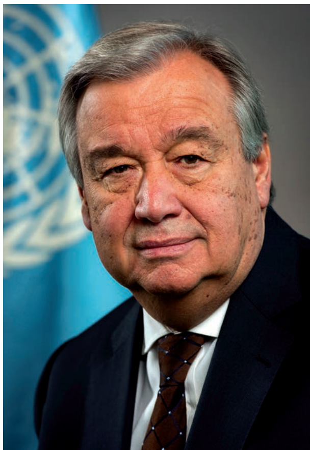
Le Secrétaire général des Nations Unies António Guterres.

4. Dans le cadre de l'établissement du présent rapport, le Département des affaires politiques du Secrétariat de l'ONU a communiqué avec les États membres des groupes régionaux de l'Assemblée générale et le Groupe des amis de la médiation. Il s'est également concerté avec des représentants d'organisations régionales et sous-régionales, du Réseau d'appui à la médiation (un réseau mondial essentiellement composé d'organisations non gouvernementales qui soutiennent les processus de paix) et du monde universitaire. ■